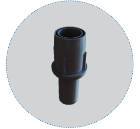
أرجل قاعدية قابلة للتعديل